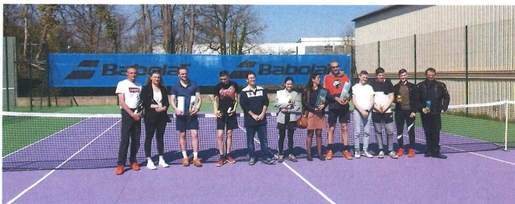
Les joueurs de Chézy récompensés à l'issue du tournoi interne.