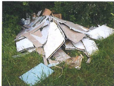
Les Murs Cliquets Juillet 2019

Le décès d'un Maire dans le Var a déclenché un phénomène médiatique sur les dépôts sauvages.