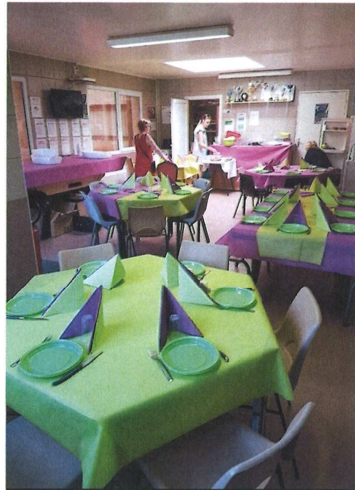
Les tables aux couleurs des terrains