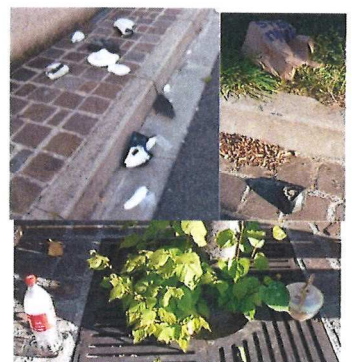
Place du Lieutenant Lehoucq Août 2019