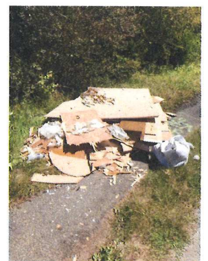
Chemin du Mont Août 2019

Les fleurs et plantes des massifs sont souvent arrachées et parfois volées.