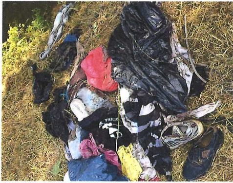
Chemin de la Bourbasse juillet 2019