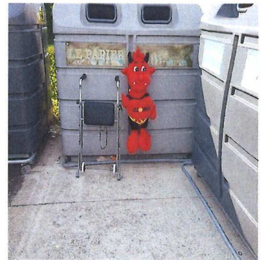
Cimetière juillet 2019