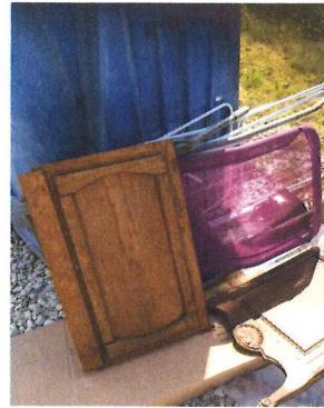
Le Moncet juillet 2019 (2)