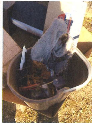
Le Moncet juillet 2019 (1)