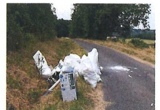
Chemin du Mont Juillet 2019