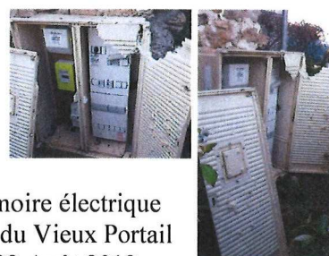
Armoire électrique Rue du Vieux Portail 23 Août 2019