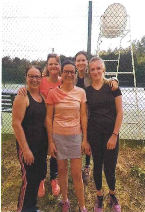
L'équipe féminine de Chézy