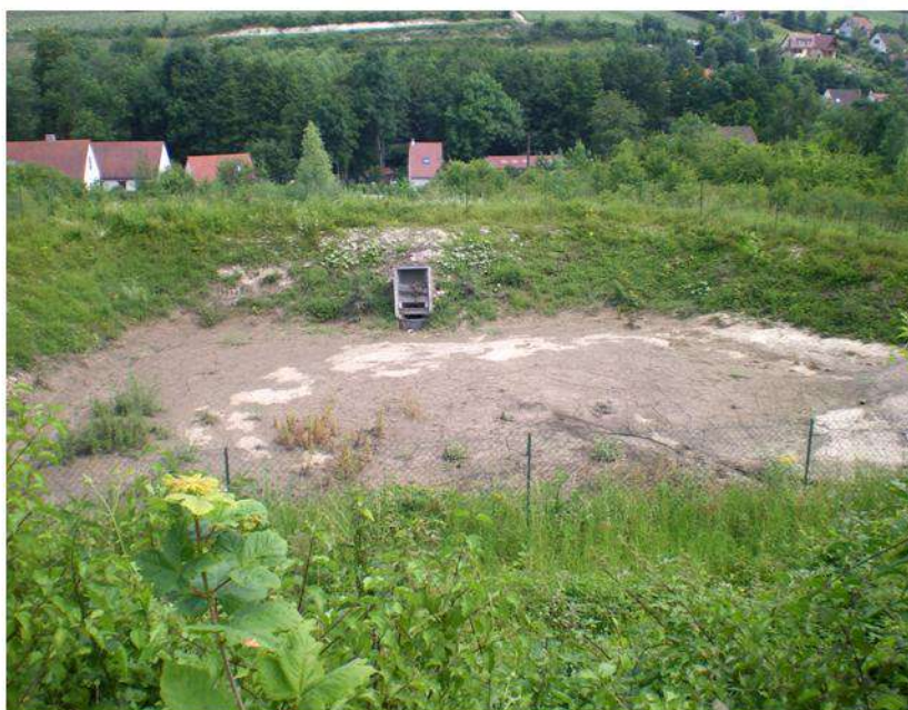
Bassin de rétention de 1 400 mètres cubes.

Le bureau d'étude chargé du projet les reportent sur les plans et dès le 17 décembre 2009, la commission hydroviticole vérifiera sur le terrain leur faisabilité.