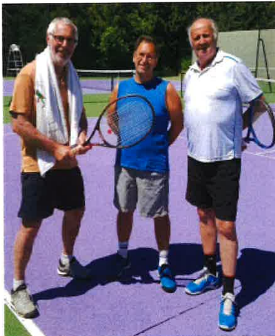
Joueurs de l'équipe +45 ans