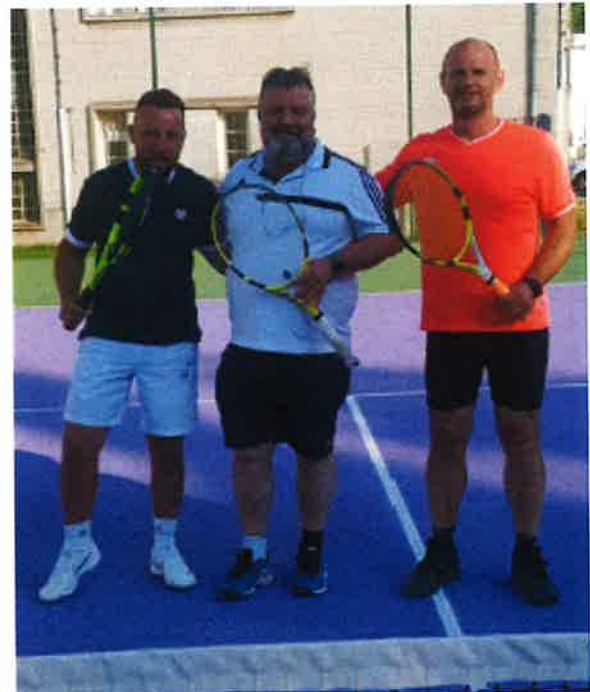
Joueurs de l'équipe +35 ans