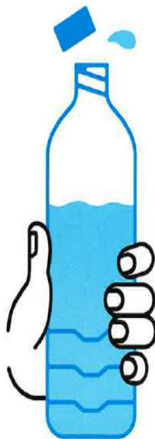
JE BOIS RÉGULIÈREMENT DE L'EAU

En période de canicule, quels sont les bons gestes?