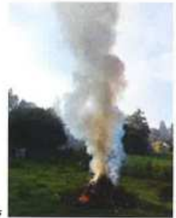
Brûlage effectué par des particuliers

Dans la région Hauts-de-France, la pollution de l'air par les particules fines (PM2.5) est à l'origine de 6 500 décès prématurés par an (source: Santé Publique France, 2016).