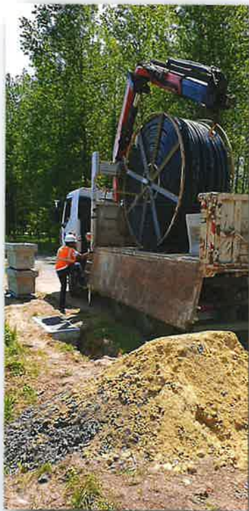
Route d'Essises Saint Jean

La pose des fourreaux pour la fibre optique est :